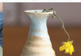
...Ästhetik in winzig